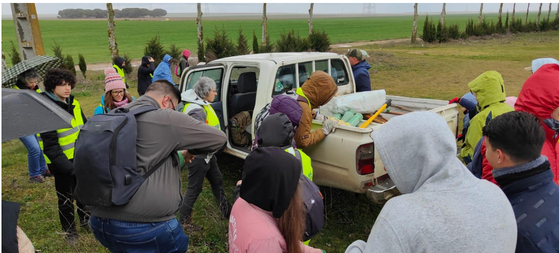
Voluntarios en la plantación de especies autóctonas en la Campa de Villalar de los Comuneros.