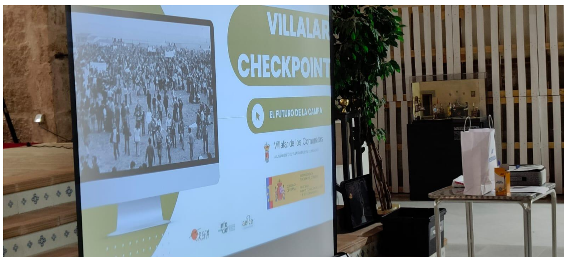
Presentación del proyecto Villalar Checkpoint