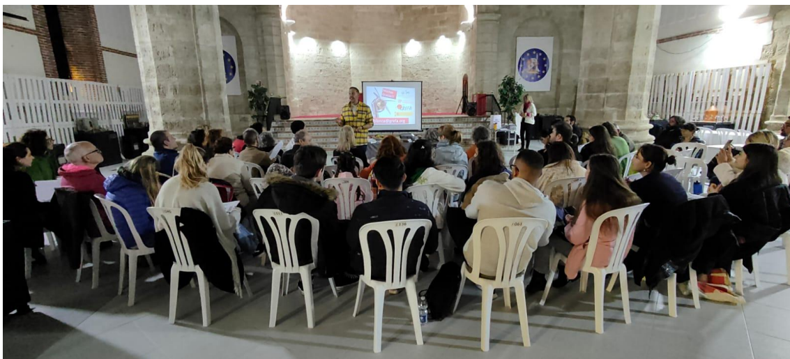
Explicación sobre la importancia de los polinizadores por GREFA