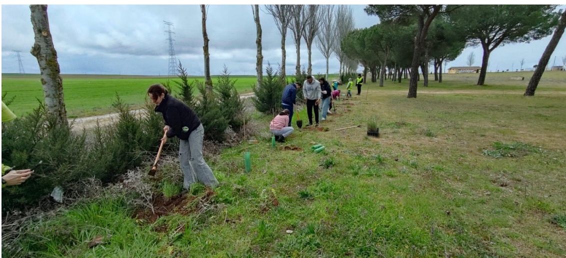
Plantación de variedades autóctonas en la Campa de Villalar de los Comuneros.